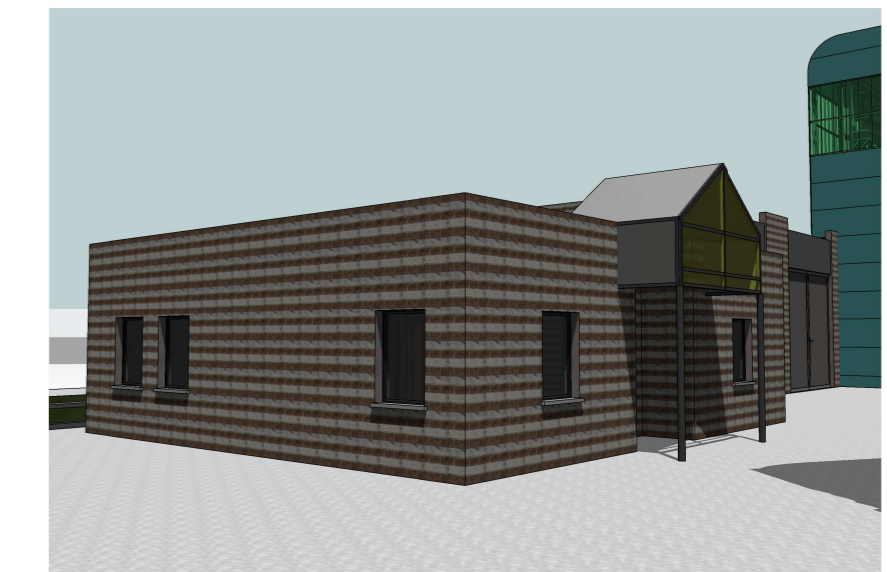
Vista prospettica Edificio Sala Controllo

N.b. La quota +0.00m di impianto assunta come riferimento, coincide con la quota assoluta di +410.50m