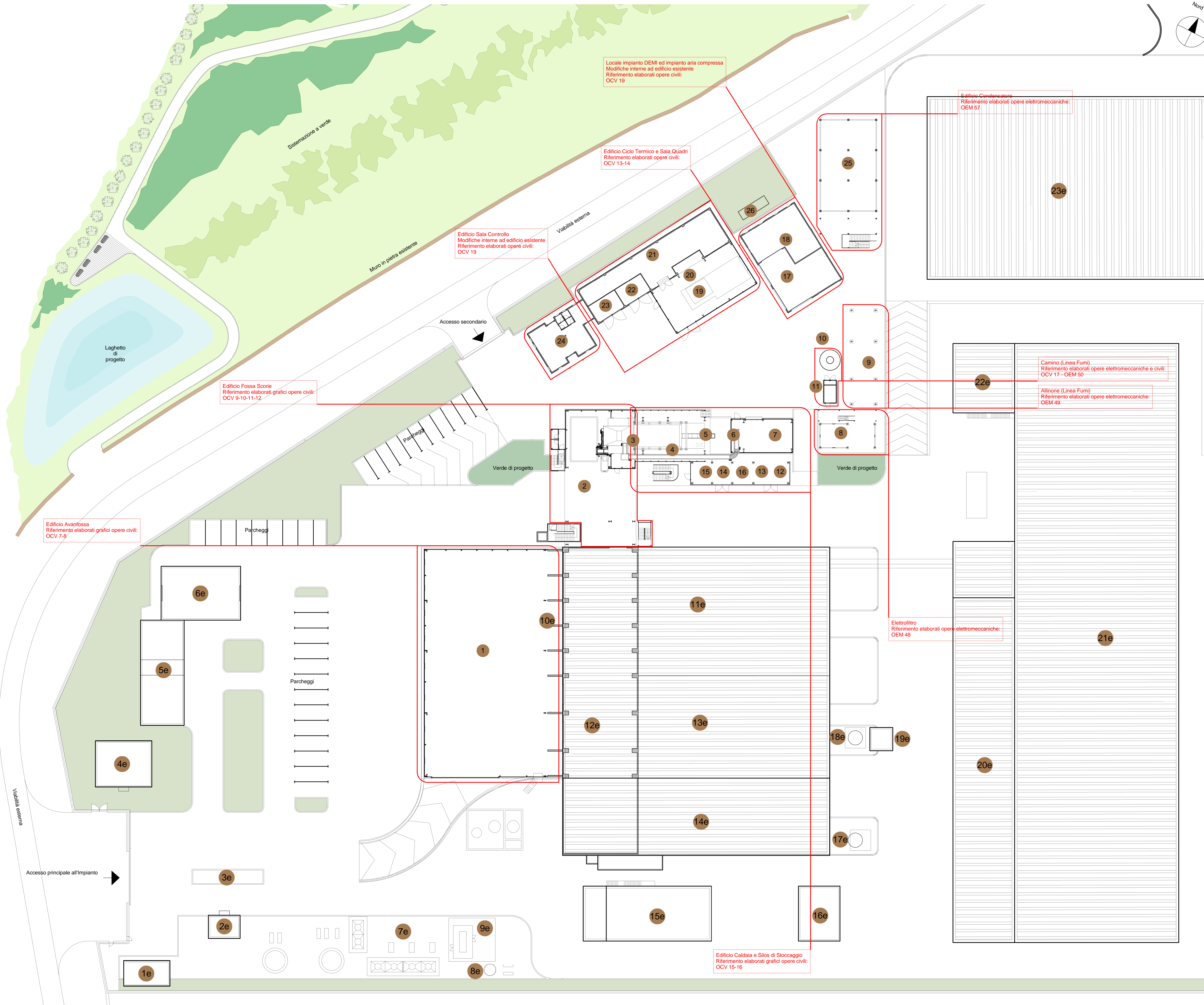
Calcolo delle superfici coperte e dei volumi di progetto