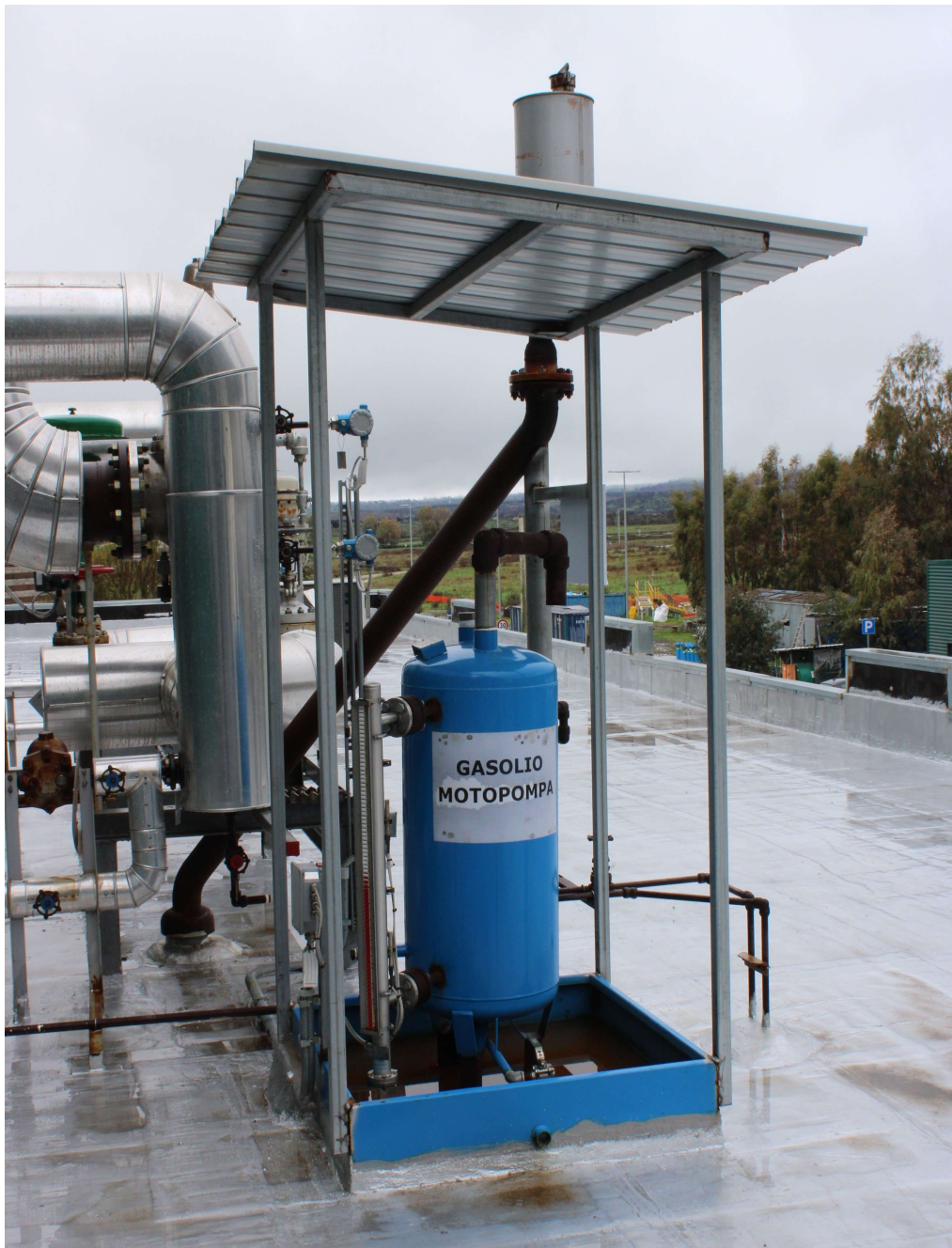
Serbatoio di gasolio C3

Serbatoio C3 - Gasolio motopompa di alimento caldaia: è un serbatoio cilindrico, in acciaio ad asse verticale fuori terra, della capacità di 155 dm 3 . Il serbatoio è ubicato sul solaio del locale sala quadri, opportunamente impermeabilizzato, dotato di tettoia di protezione e vasca di contenimento integrale in acciaio avente dimensioni interne: L 1,10 x W 1,10 x H 0,15 m (capacità 182 dm 3 ). Considerata la capacità del serbatoio, la presenza della vasca di contenimento e l'ubicazione si ritiene improbabile che tale punto di stoccaggio possa essere causa di contaminazione dei suoli e/o delle falde sotterranee.