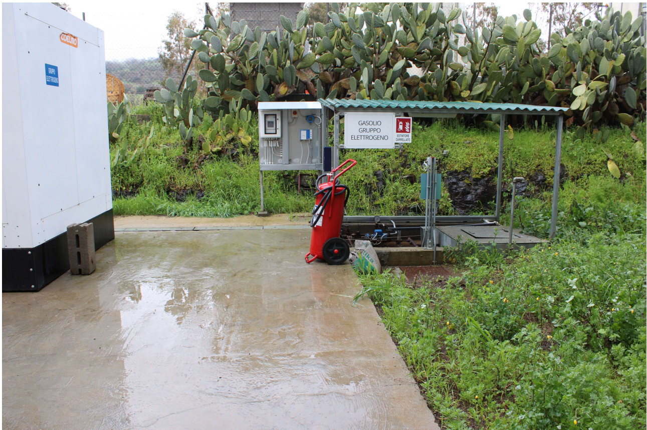
Serbatoio di gasolio C2: Punto di carico e gruppo di pompaggio

Si ritiene pertanto improbabile che tale punto di stoccaggio possa essere causa di contaminazione dei suoli e/o delle falde sotterranee.