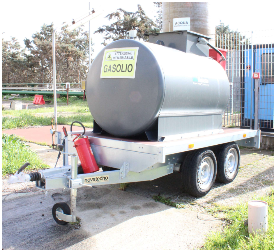
Serbatoio di gasolio C4

Si ritiene pertanto improbabile che tale punto di stoccaggio possa essere causa di contaminazione dei suoli e/o delle falde sotterranee.