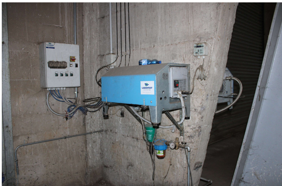
Area di stoccaggio D13 - Sistema dosaggio deodorizzante barriera osmogena