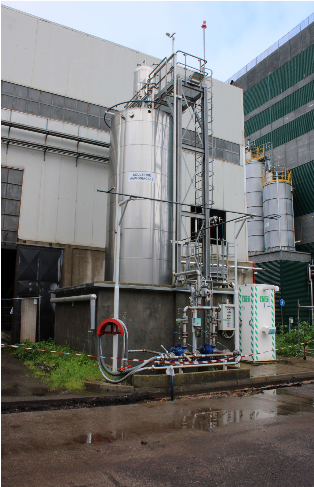
Serbatoio di stoccaggio soluzione ammoniacale D5