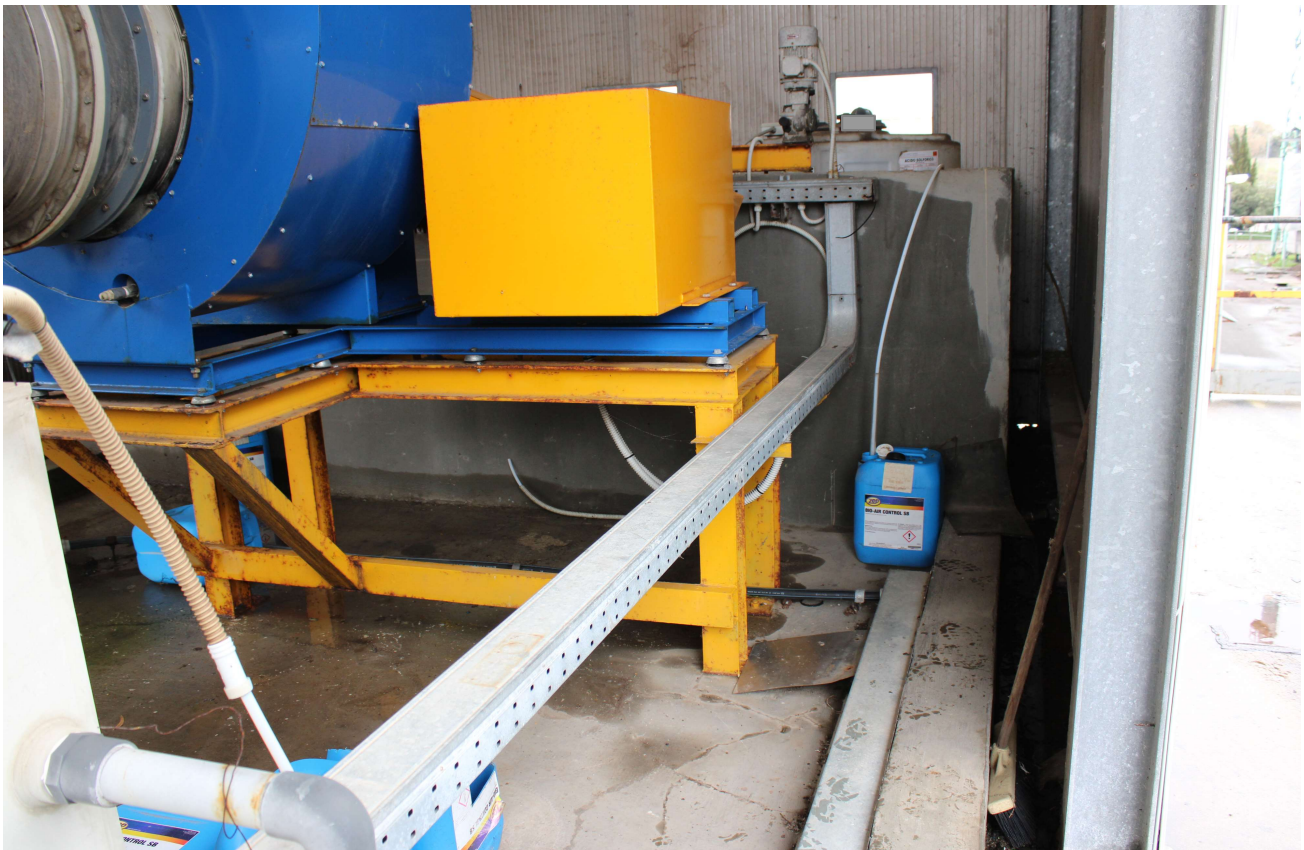
Area di stoccaggio D15 - Deodorizzante capannone maturazione compost

Considerate le modalità d'uso e di stoccaggio del prodotto, si ritiene trascurabile la probabilità che possano verificarsi fenomeni di inquinamento a causa di sversamenti e/o spandimenti accidentali.