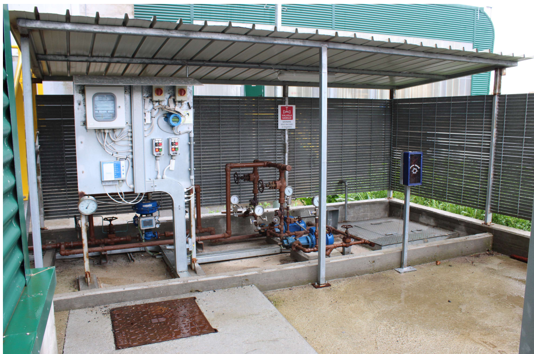
Serbatoio di gasolio C1: Punto di carico e gruppo di pompaggio

Il sistema di pompaggio e la postazione di carico sono ubicati all'esterno su un'apposita piazzola con pavimentazione in cemento e dotata di tettoia e cordolatura di contenimento onde evitare sversamenti accidentali durante le operazioni di carico.