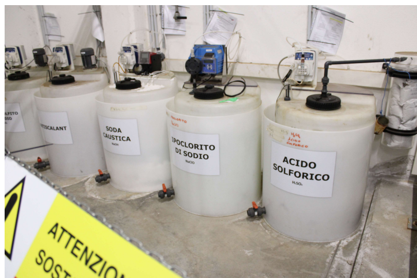
Serbatoi chemicals acqua DEMI D6 (deossigenante -Sodio bisolfito) e D9 (Ipoclorito di sodio)