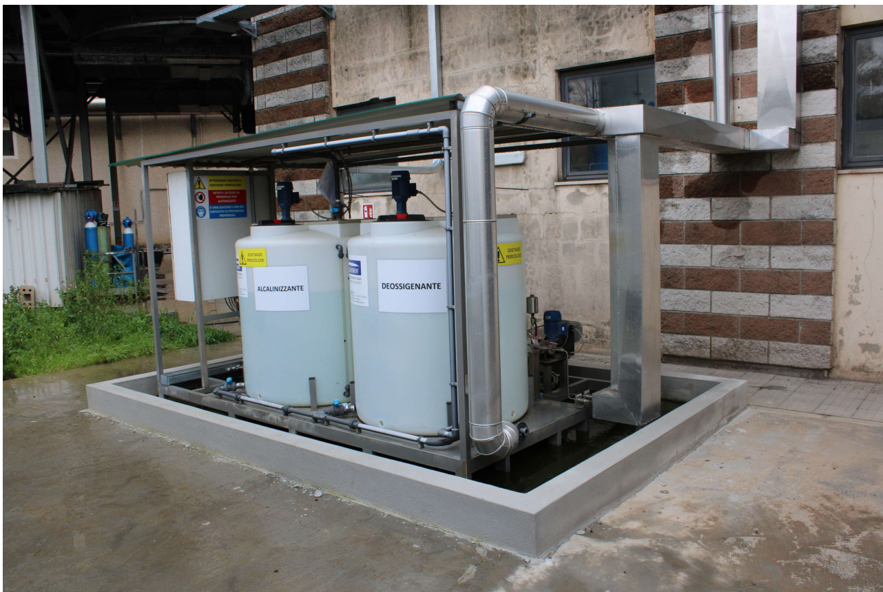
Serbatoi chemicals acqua caldaia D3 (deossigenante) e D4 (alcalinizzante)

L'interno del bacino di contenimento è impermeabilizzato con un rivestimento a base di resine epossidiche, le cui proprietà di resistenza chimica permettono di ottenere una protezione alle sostanze chimiche che possono causare il degrado della struttura ed inficiare le proprietà di contenimento. L'area circostante adibita alle operazioni di carico è realizzata con pavimentazione in calcestruzzo liscio.